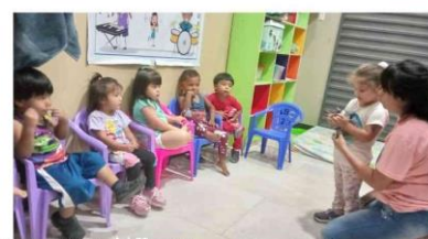
GRUPO DE 3 AÑOS 09/02/23