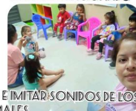
LLAMA POR SU NOMBRE E IMITAR SONIDOS DE LOS ANIMALES